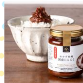
おかず味噌 国産にんにく 140g 480円