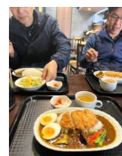
ダンケカレー ¥850 (+ミニカツ)