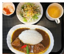
角煮ポークカレー ¥1100 ミニサラダ ¥180