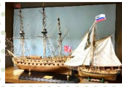
杉岡のご両親の2作品

【応募方法】お名前、ご住所、お電話番号をご記入の上、作品の写真(プリントでもデータでも可)に アピールコメント を添え、封書またはメールでお送りください。※複数応募可 【送り先】封書：〒273-0123 鎌ヶ谷市南初富6-5-65 株式会社ヤマシナ商事 島村宛 メール：yama126@yamashina-co.com 件名に「趣味自慢コンテスト係」 【応募締切】3月31日(必着)